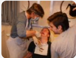
Zahnextraktion an Bord

Er muss sinnvoll abwägen: Muss der Patient schnell von